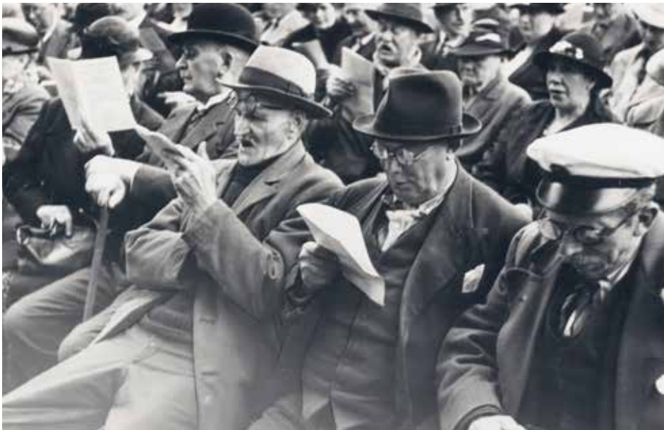
Alsang i Fælledparken, København, 1940.

utænkeligt, at mange mødte frem til alsang med det stille håb, at det måtte genere tyskerne. Men den slags tanker lader sig vanskeligt spore i det kildemateriale, som er anvendt her. På baggrund af reaktionerne i Fædrelandet og Nordschleswigsche Zeitung kunne danskerne dog være klar over, at i hvert fald de danske nazister og det tyske mindretal følte sig generet af alsangen. At utilfredsheden først og fremmest skyldtes mødeforbuddet er så en anden sag. Uanset hvordan indholdet i sange og taler fortolkes, så kunne de enorme menneskemængder, alsangen formåede at samle, utvivlsomt virke foruroligende på besættelsesmagten.