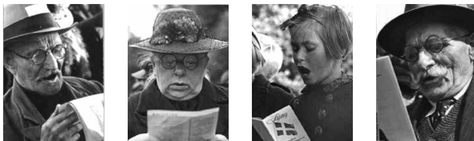
Alsangsdeltagere i Fælledparken (billede 1 og 3) og Bellahøj (billede 2 og 4), København, 1940.

kunne den ubestridelige loyalitet over for konge og regering i begyndelsen af besættelsestiden uden videre overføres til modstands-bevægelsen i slutningen af besættelsen (Kirchhoff, 1998, s. 407ff). Det er således ikke utænkeligt, at de hundredtusindvis af almindelige danskere opfattede alsangens sange i 1940 og de illegale hyldestsange til sabotører og frihedskæmpere i 1945 som to sider af samme sag.