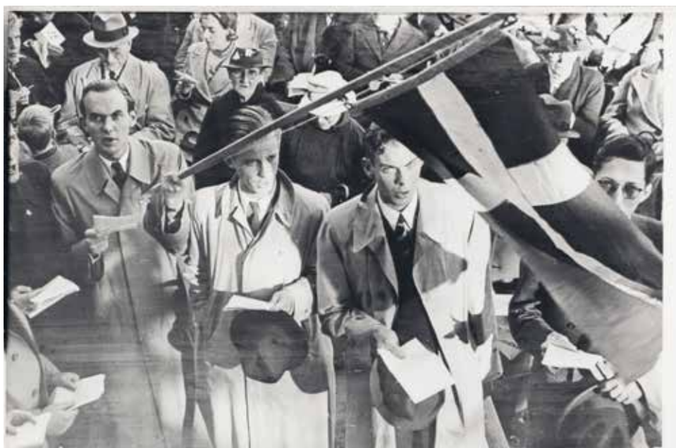
Alsang i Fælledparken, København, august 1940.

I 1943 havde 250 kor rundt om i landet planlagt at deltage i Sangens Dag, men da var stemningen ved at være vendt, jo mere modgang Nazityskland mødte i krigen, jo mindre opbakning var der til samlingsregeringens forhandlingspolitik og samarbejde med tyskerne. Der udbrød omfattende strejker, hvilket resulterede i mødeforbud, og alle arrangementer blev aflyst. Dermed må alsangen som udtryk for den nationale stemning siges at være forbi.