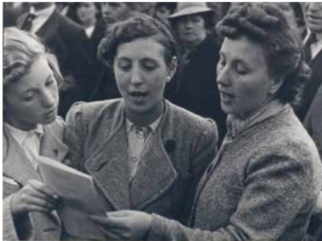
Alsang i Fælledparken, København, august 1940.

fædrelandet forestilles som en kvinde eller en moderskikkelse, medfører det, at forholdet til nationen forestilles som et naturgivent forhold, som et slægtskab, hvor børnenes kærlighed til moderen (eller faderen) er selvopofrende og betingelsesløs. Og ethvert angreb på landet er at sammenligne med et overgreb på den uskyldige moder eller kvinde, som har brug for sine børns hjælp til at beskytte sig. I Imagined Communities beskriver etnologen Benedict Anderson, hvordan kærligheden til nationen ofte beskrives med et ordvalg, der knytter sig til slægten eller hjemmet (motherland, Vaterland, Heimat), dvs. noget man naturligt er bundet til, og som man ikke selv har valgt. Det medfører, at der er en storhed over det at dø for sit land, som ikke kan opnås ved at dø for et parti eller en forening, som enhver kan melde sig ind i og ud af. At der henvises til vor gamle Mor og Danmark i tusind år er ligeledes et af nationalfølelsens eller nationalismens kendetegn. Nationer har brug for dels at legitimere sig udadtil, dels at styrke fællesskabet i befolkningen ved at fokusere på en fælles fortid frem for eventuelle forskelle i nutiden (Anderson, 1991, s. 5 og 11 ff). Således tages der i de danske fædrelandssange heller ikke hensyn til, at "Danmark" igennem de tusinde år har haft forskellige grænser, og at folket har talt andre sprog end dansk, som fx norsk og tysk.